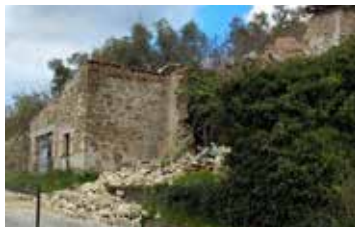
La casa franata a Vignoli

La frazione dimenticata, ma soprattutto in balia degli eventi e di crolli che tengono in apprensione la decina di famiglie che vivono in quella zona e non intendono abbandonarla. Il crollo di una casa a Vignoli , disabitata dagli anni '80, è stato