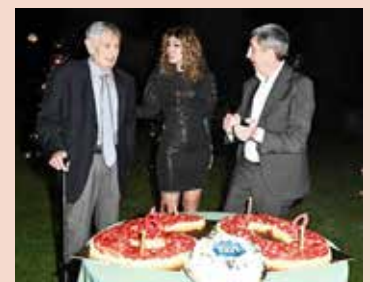
La torta per la festa dei 60 anni