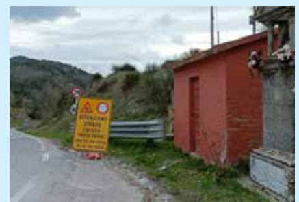
La segnaletica fuorviante

C'è stata una confusione clamorosa perché la Polizia Locale di Gubbio ha fatto sapere del traffico deviato dentro San Martino. La disputa è perché quel cartello non si sarebbe dovuto posizionare poiché fuorviante e senza un'ordinanza che lo legittimasse. Chi si trovava a percorrere la strada del Bottaccione e ha visto questo cartello, quasi sicuramente è tornato indietro mentre invece è stato consentito l'accesso per l'edicola di Santa Lucia in entrata e in uscita passando per San Martino.