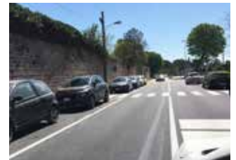
Il nuovo asfalto

una ricorrente consuetudine di "interpretare" norme e procedure, ha deciso di spendere una sostanziosa parte del finanziamento per la sistemazione di un ponte lungo il Bottaccione e un'altra parte dei fondi per sistemare e asfaltare viale del Teatro Romano nel tratto dalla