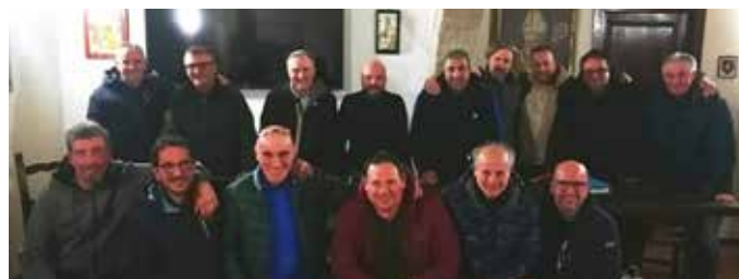
Il consiglio dei quindici soci più eletti

“A me non sembra e se ci fosse qualcuno che dovesse avere questa impressione, lo inviterei a documentarsi prima di sminuire il lavoro che l'Università svolge a servizio della città. Durante il periodo dei Ceri vengono organizzati solo pranzi e cene collocati all'interno della tradizione e della storia di questa nostra festa meravigliosa, evitando convivi fuori dalle regole e in contesti sbagliati. Gli Arconi sono la casa dei ceraioli e degli eugubini. Durante l'anno le sale vengono utilizzate e date in uso solo ad associazioni del territorio per ospitare manifestazioni ed eventi che danno lustro alla nostra città e mai per scopi privati. Dietro a tutto questo c'è il sacrificio e la dedizione dei nostri soci che garantiscono il corretto svolgimento degli eventi in maniera del tutto gratuita ed è triste e demotivante pensare che qualcuno dia spazio a certe illusioni. Dal canto nostro, noi ci adoperiamo per cercare di essere costantemente corretti e rispettosi della storia, le tradizioni e le persone, sicuri di agire sempre con l'unico obiettivo di essere al servizio della città”.