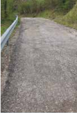
Le strade non sistemate

Soldi annunciati e poi dirottati chissà dove e per chissà cosa. La storia si ripete guardando le condizioni disastrose della strada comunale numero 79 del Vago , nella zona San Martino in Colle, e alle promesse della Giunta Stirati, che aveva stanziato nel bilancio 2023 la somma di 70mila euro per la sistemazione tra buche, avvallamenti e situazioni di pericolo in un tratto dove la pioggia porta l'acqua a valle creando grossi problemi a una famiglia. Nel 2008 quella famiglia era stata costretta a evacuare dopo