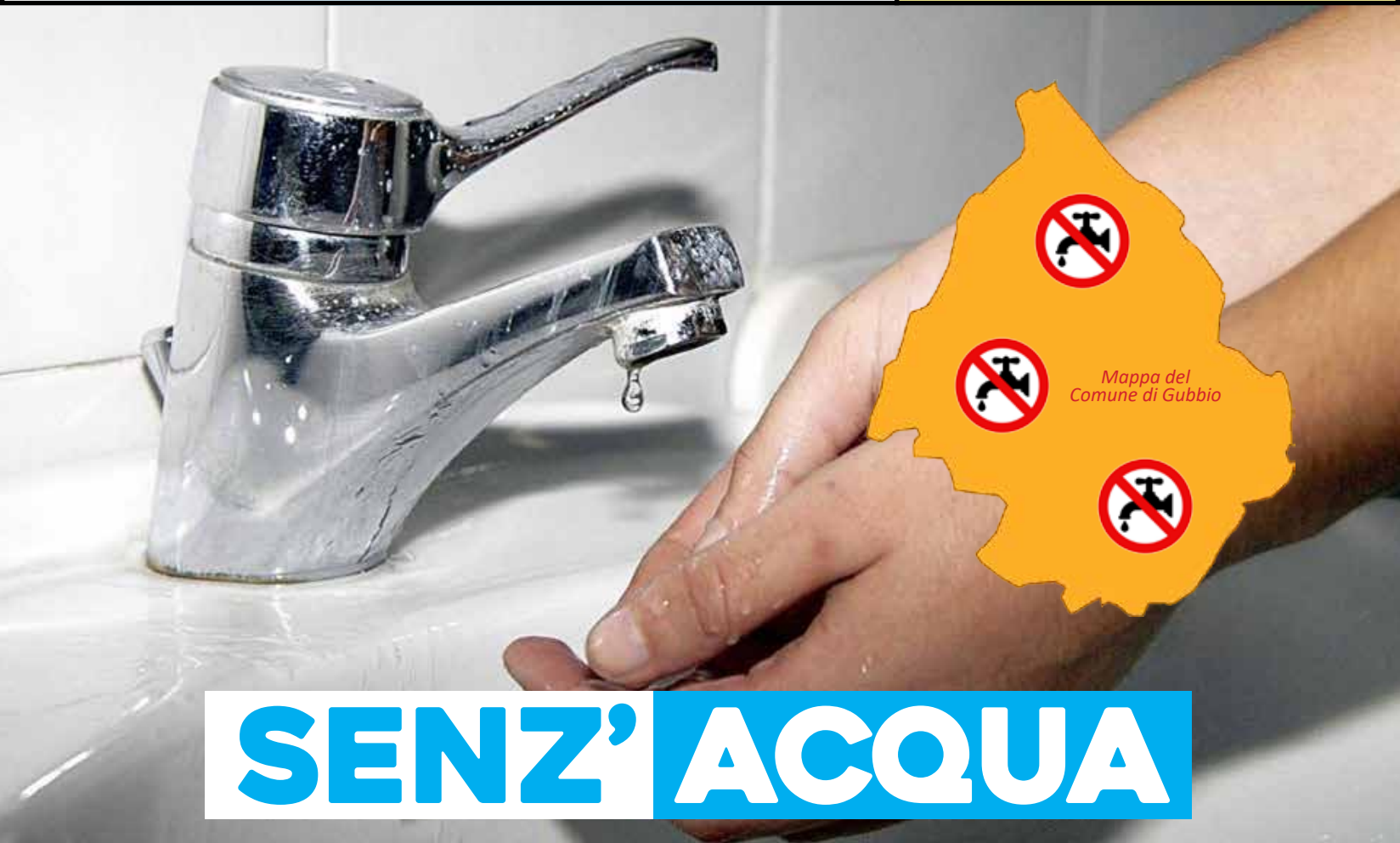
Mapa del Comune di Gubbio