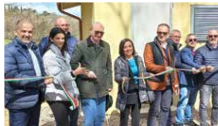
L'inaugurazione dell'acquedotto di Mengara

La Giunta Stirati, sempre in prima fila con i nastri da tagliare e per inciuciare con i carrozzoni pubblici ammantati di privato, ha scaricato la faccenda su Umbra Acqua e Auri