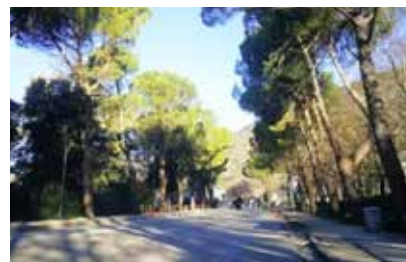
Viale del Teatro Romano

tato il nostro ricorso ma al contrario abbiamo ottenuto due posti auto nel parcheggio dell'Usl. Il tribunale ha infatti riconosciuto la sussistenza del danno per l'attività e per i soggetti con disabilità che hanno gli spazi interdetti".