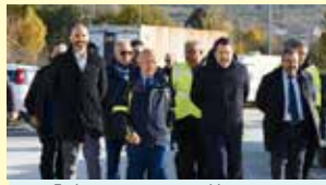
Salvini in visita a Mocaiana

Questo nuovo tratto si estende in prosecuzione di quello già realizzato fino a Mocaiana e costituisce il primo dei due stralci dell'ulti-