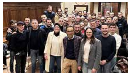
Traversini e la sezione AIA

re la nostra sezione a essere sempre più apprezzata anche al di fuori dei confini regionali. Credo che non avremmo potuto individuare figura migliore per aprire una nuova fase".