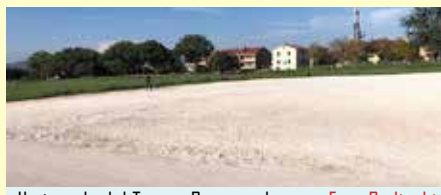
Il piazzale del Teatro Romano deserto

Ieri come oggi, oggi come domani: sono penose le condizioni in cui versa il piazzale adibito a parcheggio a pagamento nella zona archeologica del Teatro Romano . L'area davanti al monumento si presenta come un deserto, senza auto, e con il fondo malridotto per le buche. La Giunta Fiorucci ri-