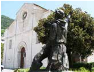
La Statua di San Francesco

C'era da aspettarselo che non sarebbe cambiato nulla. Non è un problema di colore politico, cioè immaginare che avere il governo della città come quello di Stato e Regione possa dare dei vantaggi. È stato così con la sinistra ed è così con la destra che anzi, dopo 78 anni di vani